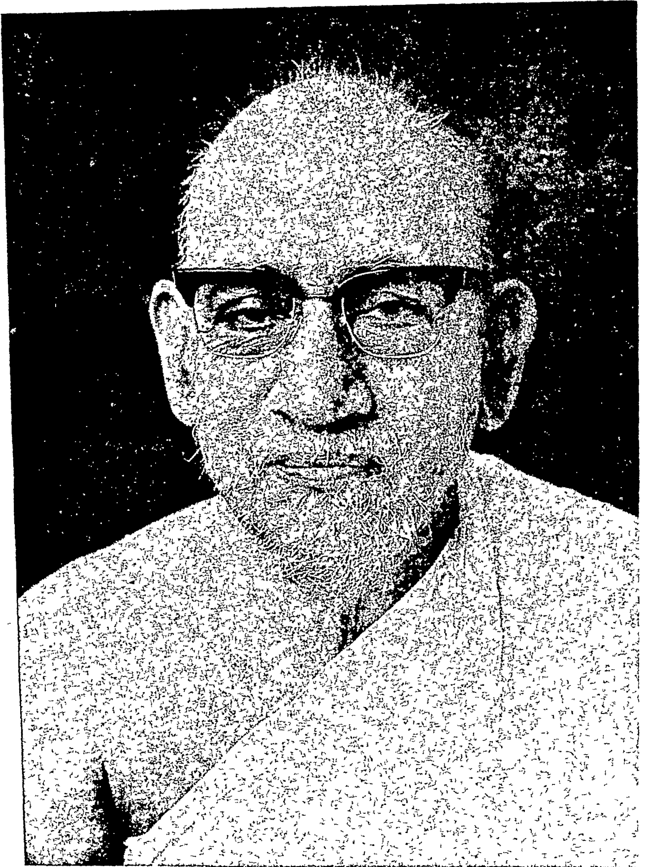
आगमप्रभाकर मुनिश्री पुण्यविजयजी विक्रम-१९५२ — २०२७